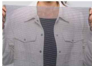
Animal Screen Polyestergewebe